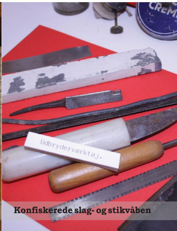
Konfiskerede slag- og stikvåben